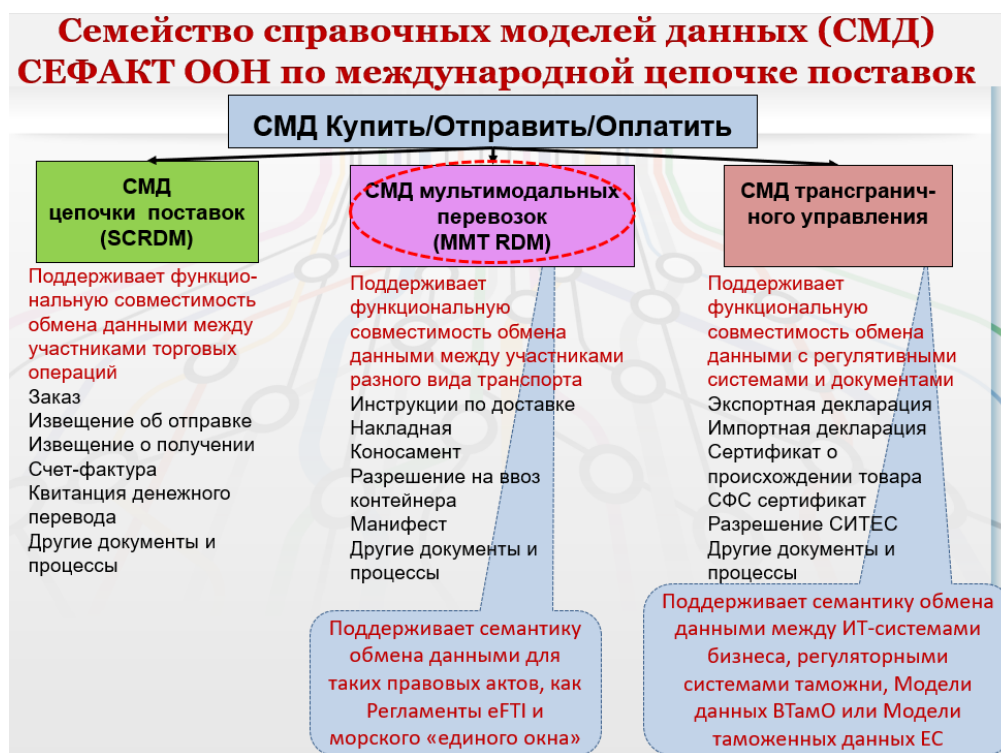
Рисунок 1: Стандарты и семейство эталонных моделей данных, обеспечивающих функциональную совместимость в цепочке поставок

В области электронных деловых операций СЕФАКТ ООН сосредоточил свое внимание на разработке семантических стандартов, РДМ и справочников в качестве основы для обмена данными между заинтересованными сторонами в производственно-сбытовой цепочке. В эпоху Интернета они рассматриваются в качестве стандартов следующего поколения, выходящих за рамки широко используемых в настоящее время сообщений ЭДИФАКТ ООН для обмена данными и информацией. В этом заключается суть работы СЕФАКТ ООН над стандартами в различных областях: сельскохозяйственными сертификатами, торговыми и логистическими документами, транспортными документами и нормативными документами. Цель - обеспечить общий знаменатель для обмена данными.