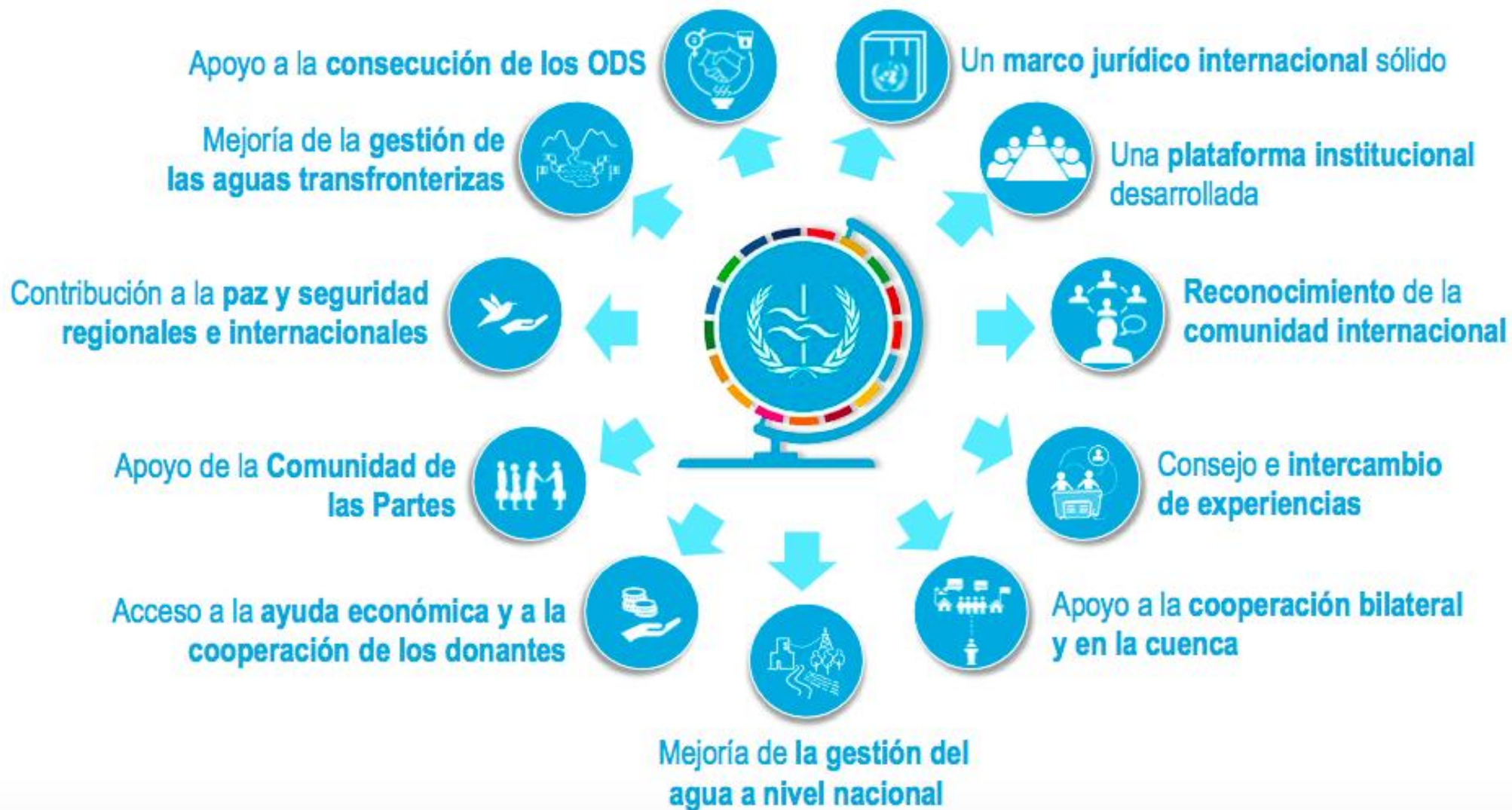
Figura 1: ¿Qué logra mi país al convertirse en una Parte en el Convenio del Agua?