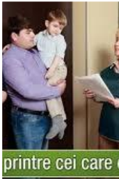
printre cei care

Решение правительства о следующей переписи 2024 года находится на стадии консультаций