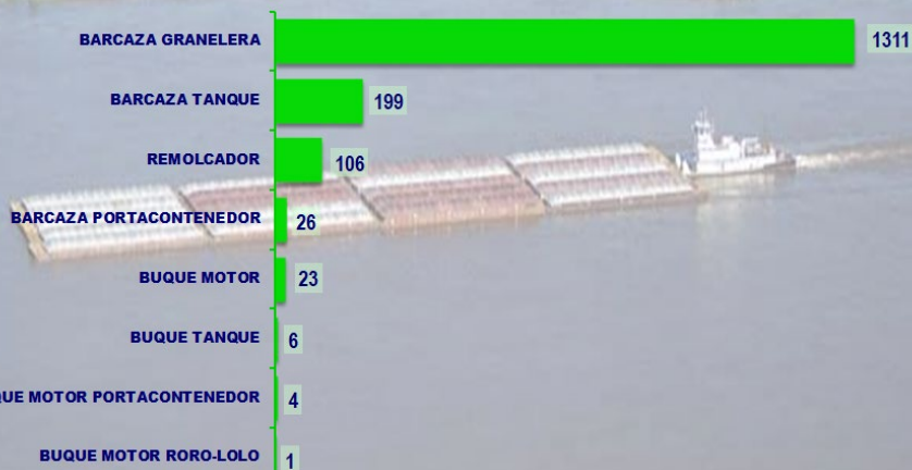
CANTIDAD DE EMBARCACIONES PARAGUAYAS HABILITADAS PARA OPERAR EN EL TRÁFICO INTERNACIONAL DE TRANSPORTE FLUVIAL DE CARGAS