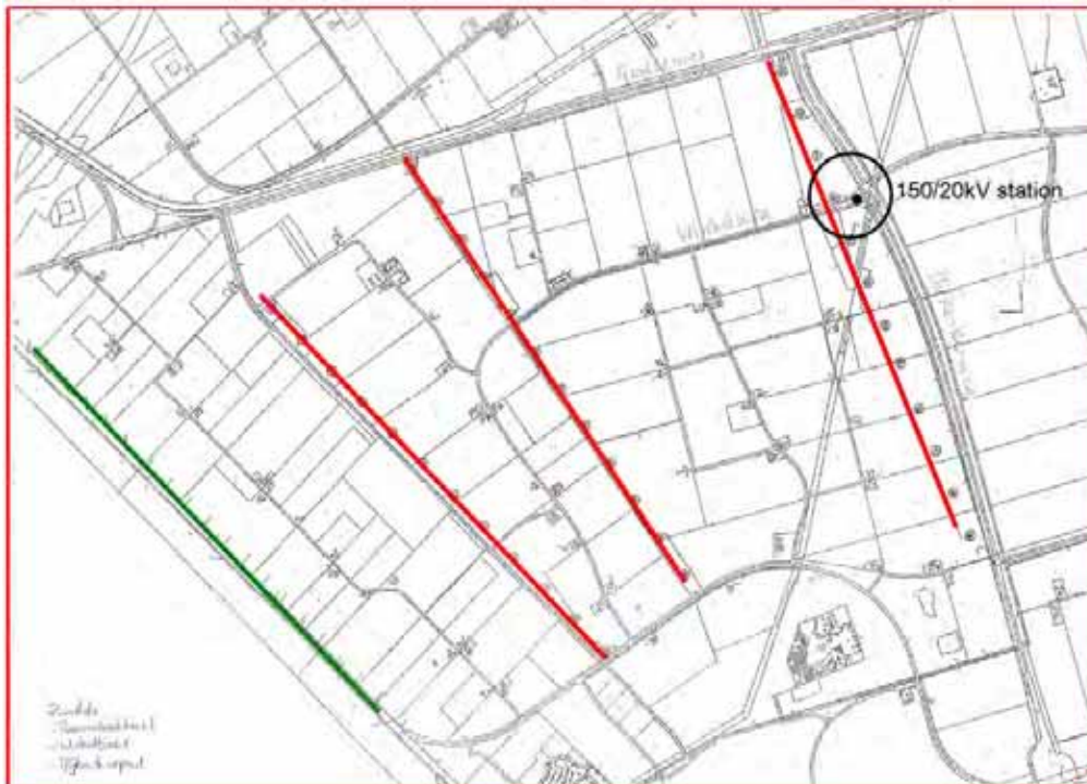
Figuur 1 Drie lijnopstellingen (rood) en het onderstation (150/20kVstation). De groene lijn is de bestaande windturbineopstelling nabij de Eemmeerdijk

De keuze voor de locatie van het windturbinepark in de Zuidlob is deels ingegeven door de geschiedenis van het initiatief en deels door de locatiekenmerken van de Zuidlob. Het initiatief is medio 2004 opgepakt. Er was toen sprake van opschaling van een lokaal initiatief binnen de gemeente Zeewolde. Het oorspronkelijke plan als geheel voldeed aan het toen geldende gemeentelijke en provinciaal beleid. De provincie heeft van het initiatief een pilotproject gemaakt. Vanuit de gedachte 'minder molens, meer energie' hebben de initiatiefnemers het huidige plan samen met gemeente en provincie ontworpen. Daarmee is bereikt dat alle bewoners van de Zuidlob mee kunnen doen in het windpark en dat de bestaande kleine windturbines gesaneerd kunnen worden. Er worden hierdoor niet alleen meer MW's geplaatst, maar door de gunstige lijnopstelling zal de energieopbrengst per MW ook groter zijn. Overigens moet worden opgemerkt dat niet alle bewoners van het gebied participeren in het project. De lijnopstelling zoals deze nu in het inpassingsplan mogelijk wordt gemaakt is zorgvuldig gekozen. Oorspronkelijk zijn 14 alternatieve opstellingen binnen de Zuidlob onderzocht. Deze alternatieve opstellingen zijn eveneens in het planMER (2009) opgenomen. Op basis van milieueffecten, openheid, realiseerbaarheid, rendement en de gevoeligheid van het gebied is gekozen voor de huidige lijnopstellingen. Verwezen wordt naar figuur 1.