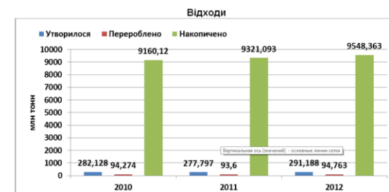
Рис. 14. Динаміка основних показників утворення та доведення до відходів в