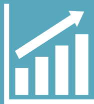
График реализации проекта по разработке проекта внесения изменений в действующее законодательство РТ