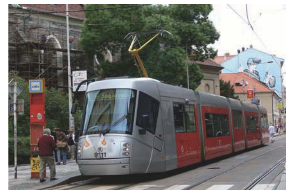
Хорошо работающая система общественного пассажирского транспорта – признак города, в котором приятно жить