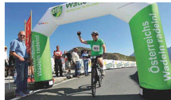
Министр сельского и лесного хозяйства, охраны окружающей среды и водных ресурсов Австрии Николаус Берлакович приходит к финишу в первой гонке велосипедов с электродвигателями на перевале Гроссглокнер