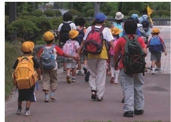
Пешеходный Автобус- естественный вид передвижения - не только сохраняет окружающую среду, но и даёт детям дополнительную возможность двигаться и общаться