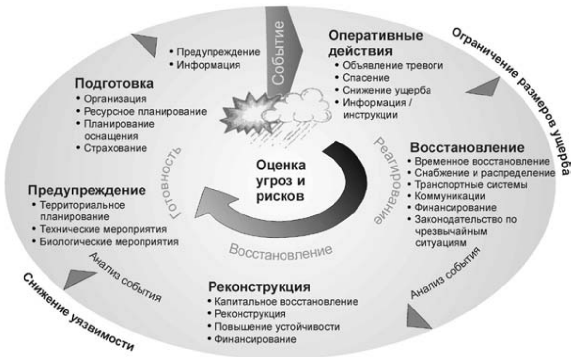
Рисунок 1: Цикл комплексного управления рисками.