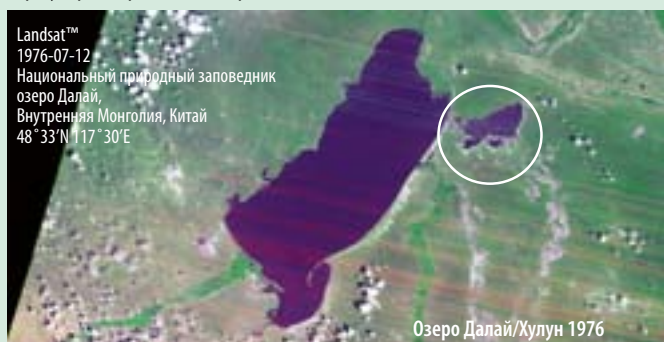
РИСУНОК 1. Два спутниковых снимка озера Далай/Хулун, изображающие динамику высыхания и наполнения водных объектов в зависимости от климатического цикла. «Новый Далай» - мелкая впадина на западе озера Далай/Хулун (обведена) – регулярно пересыхает (2-3 раза в течение XX века).