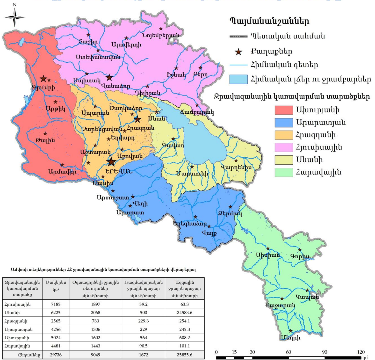
Նկար 1 – Հայաստանի ջրավազանային կառավարման տարածքները

Ջրավազանային տարածքային կառավարման բաժինները պատասխանատու են ավազանային մակարդակով ջրավազանային կառավարման պլանների մշակման, ջրօգտագործման թույլտվությունների գրանցման, ջրային ռեսուրսների պահպանության ապահովման, ջրօգտագործման թույլտվություններով ամրագրված պայմանների իրավակիրարկման, ջրառի ռեժիմի սահմանման, ինչպես նաև ստեղծված վեց ջրավազանային կառավարման տարածքների համար ջրային ռեսուրսների բաշխման պլանների մշակման համար: